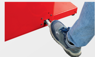
8-21900207 PB Fußbremse