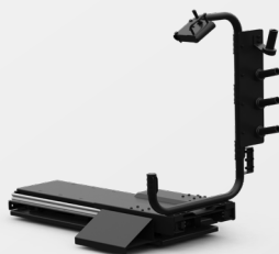
8-21100161/90 WL 80 UP Radheber