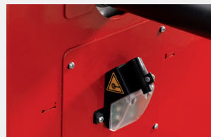
8-21100238 LL Kit LED-Innenbeleuchtung für das Rad + Laserpointer