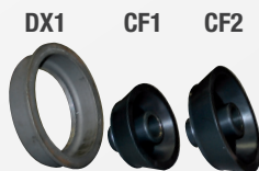
8-21100141 DX/CBF Zentrierzubehör für Transporter und SUVs mit Mittenloch ∅ 117-173 mm