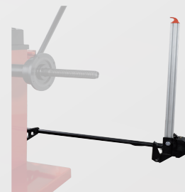
8-21900209 TL-2 UP Felgenbreitenmessgerät mit Halterung